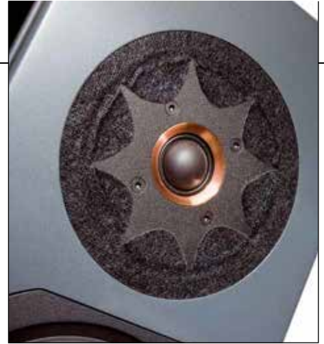
Die edle Kalotte stammt aus prominenter skandinavischer Fertigung und gehört zum erlauchten Kreis der weltbesten Hochtöner

Ich will mich nicht länger bei den konstruktiven Besonderheiten aufhalten. Und deshalb geht es in den Messraum, wo die Konzert III den Musterschüler gibt. Sehr linearer Frequenzgang, schnelle Impulsantworten und ein sauberes, schnell abklingendes Zerfallsspektrum ohne signifikante Störungen zeigen schnell, dass man der Kontrast messtechnisch nicht am Zeug flicken kann. Also weiter in den Hörraum.