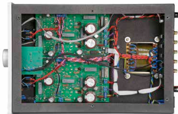
▲ Der spiegelsymmetrische Aufbau ist sehr sauber und akkurat gemacht.

dürfen, nehmen sich je Kanal zwei parallel geschaltete Doppeltrioden ECC83 sowie eine ECC82 als Phasensplitterstufe des Signals an. Selbstredend sind alle Röhren gemacht.