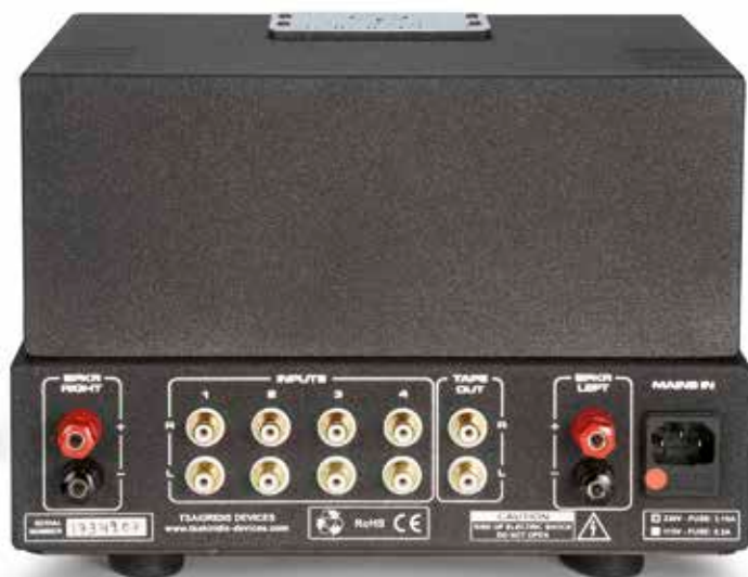
◀ Der Vollverstärker bietet vier Hochpegelquellen Anschluss, die Ausgangsübertrager haben nur einen Abgriff für alle Lasten.

1900 Euro sind für die meisten von uns spürbar viel Geld – aber für einen so prächtigen Vollverstärker ist es im realistischen Vergleich tatsächlich doch eher wenig. Kaum ein Mitarbeiter hier hätte den Aeolus nicht auf den fast doppelten Preis geschätzt. Dieser Tsakiridis ist ein schon unmoralisch anmutendes und sehr verführerisches Angebot, die Ersparnisse nachhaltig zu investieren!